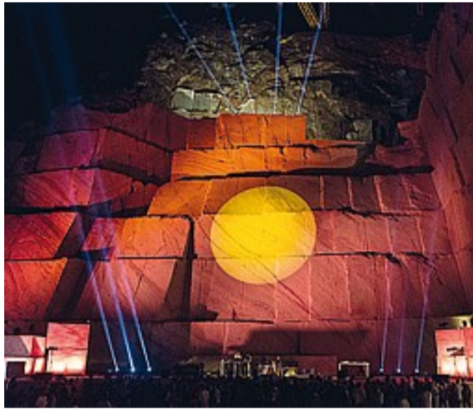
Suggestioni Il palco principale della rassegna vicino al lago Maggiore